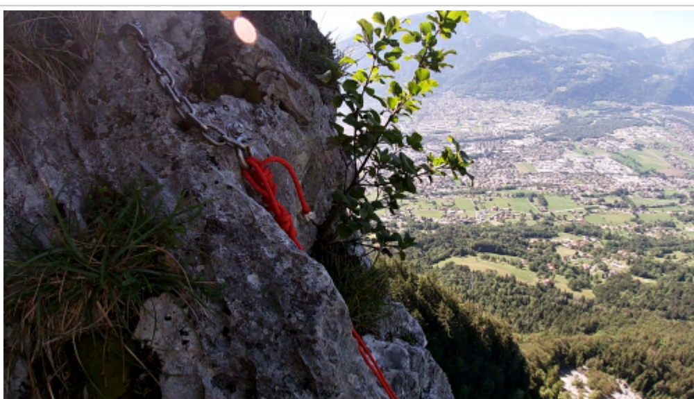
"Relais à l'exit"