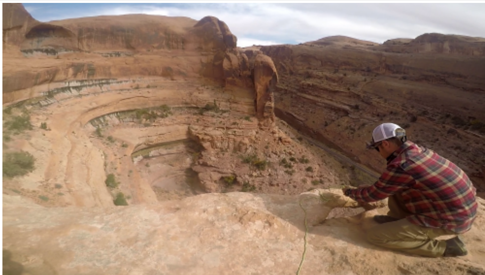
Lunule pour la static. line à l'exit

Une static. line à faire pour l'ambiance mythique, le retour se fait par la voie de chemin de fer dans un canyon que l'on croise à la montée, attention la voie est encore active ! Posé assez technique entre des cactus.