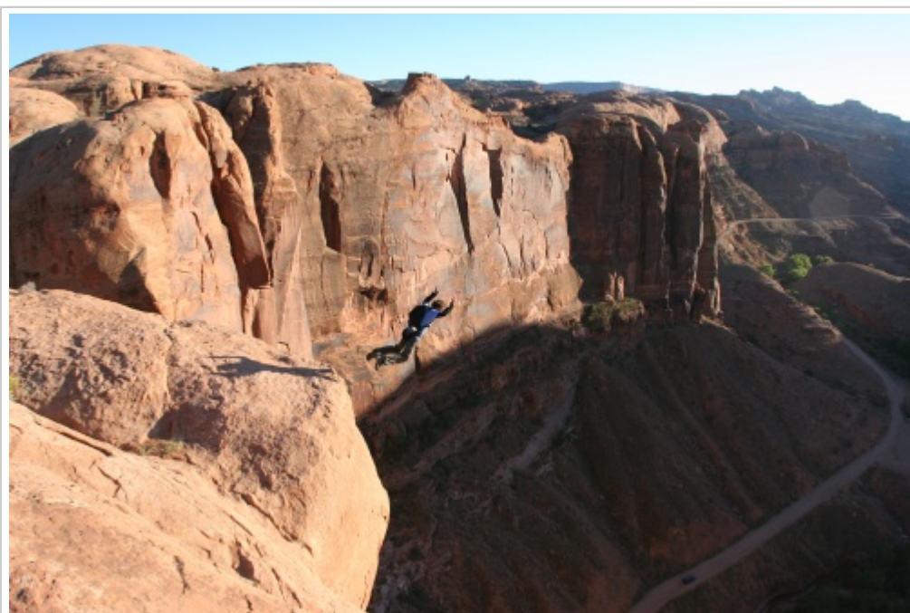
Exit basse depuis l'exit haute. Arrière-plan : the Crown