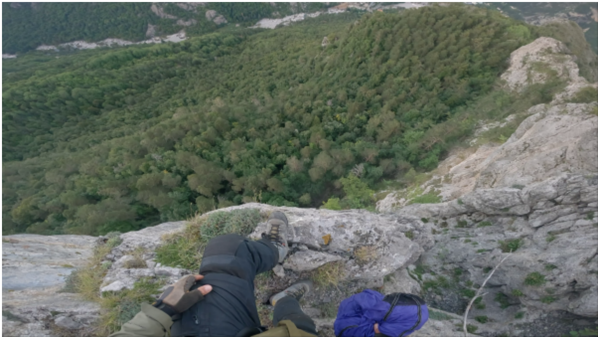
Vue de l'exit

Récupérée de « https://www.base-jump.org/topo/index.php?title=Stairway_to_exit_2&oldid=9636 »