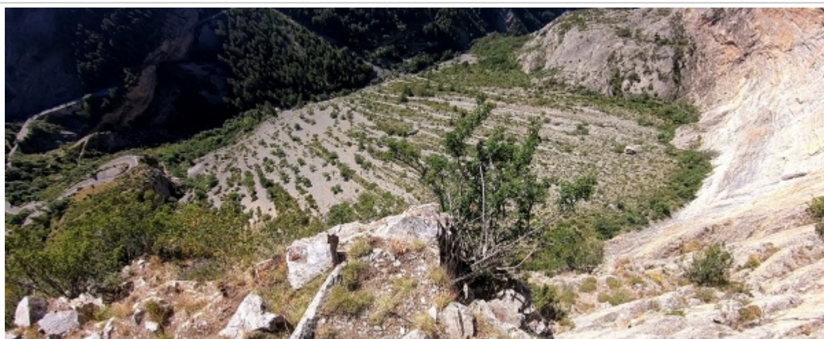
Vue de l'exit