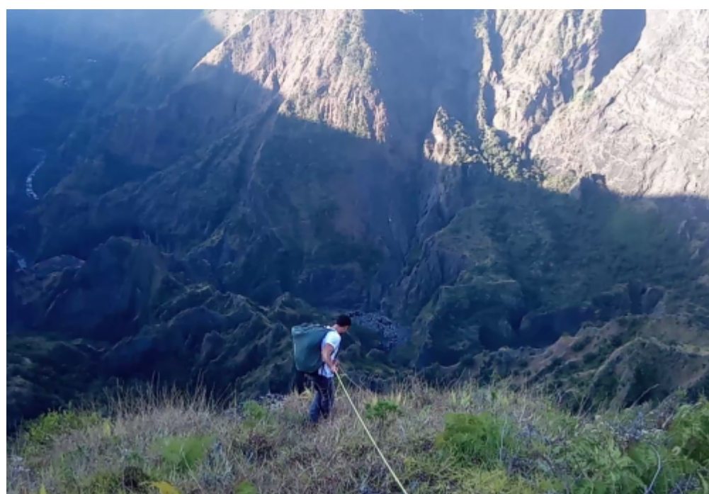
accès à l'exit avec la main