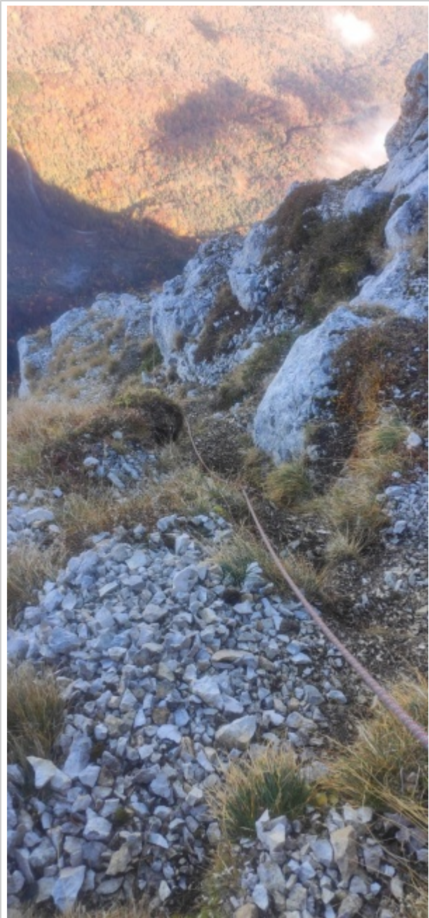
Descente vers l'exit de la Croix

De Chambéry monter au col du Granier puis à la station du Granier et enfin à la Plagne (terminus voiture). Suivre un bon chemin jusqu'au sommet du Granier. Il est possible de monter plus directement le long de la piste de ski par un raide sentier. Du sommet, pour le spot original suivre la crête vers l'est jusqu'à une partie jaune bien visible du col du Granier. Ce spot n'est actuellement