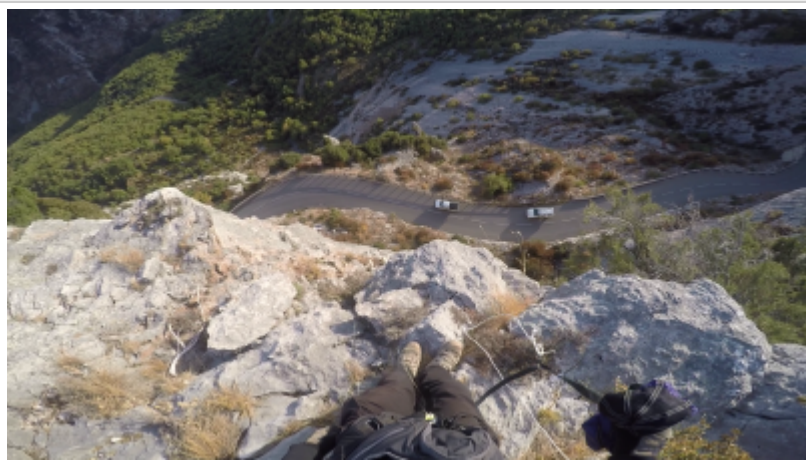
Vue de l'exit

Récupérée de « https://www.base-jump.org/topo/index.php?title=Pas_de_Tous_Vents&oldid=7682 »