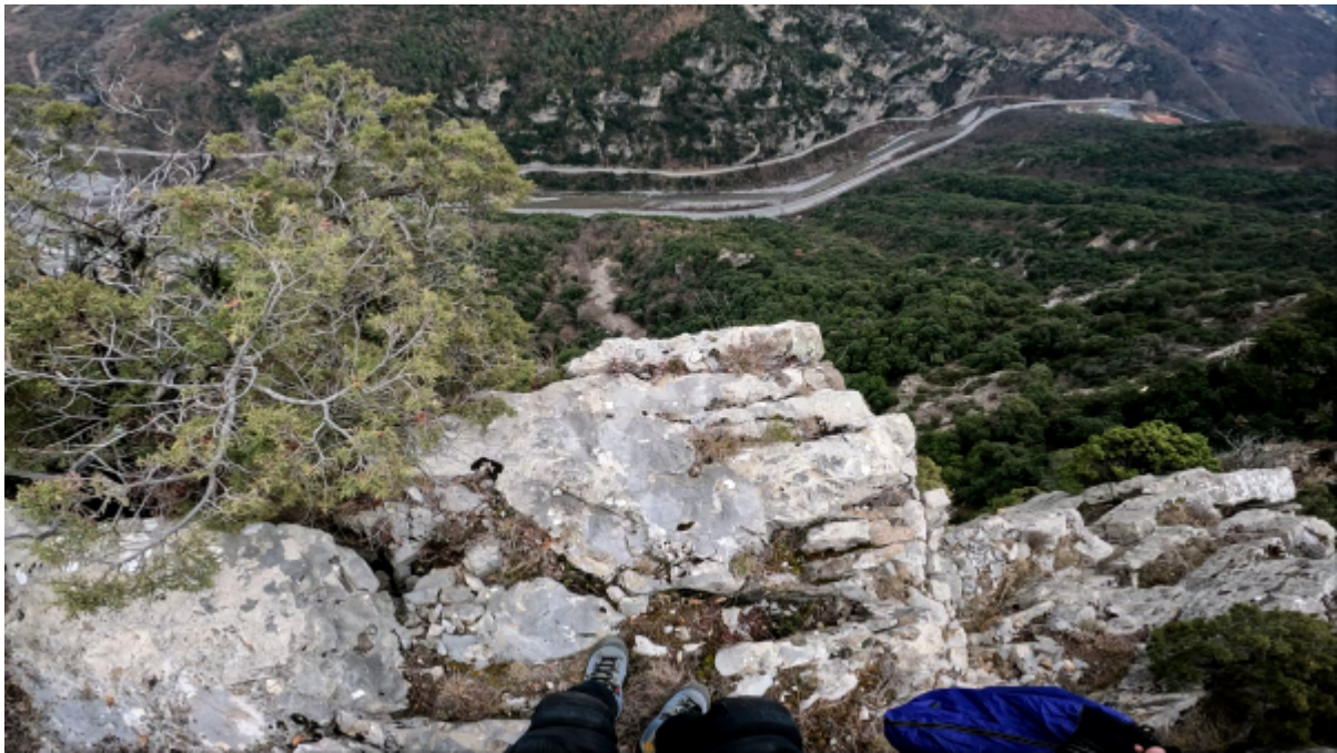
Vue de l'exit

Récupérée de « https://www.base-jump.org/topo/index.php?title=Pas_de_Combé&oldid=9428 »