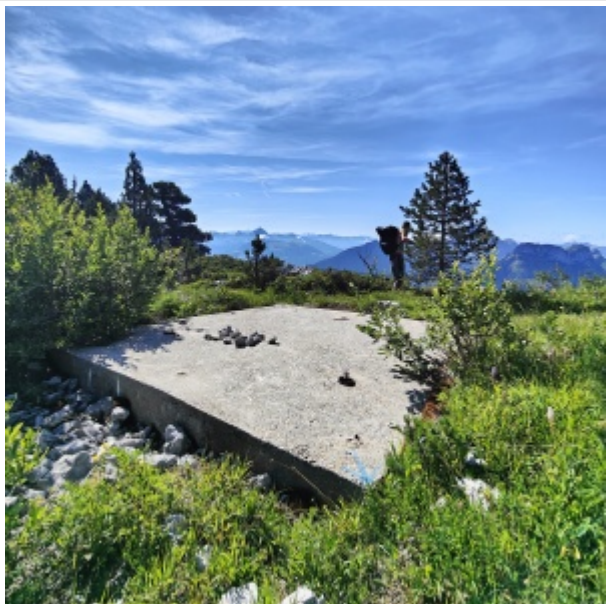
Ce qu'il reste des antennes

Au début, comme pour la Tête à Turpin : sur la route entre Dingy St clair et Thones, au hameau de Charvex, emprunter une petite route montante vers la falaise, se garer au terminus et emprunter le large chemin qui suit, puis après 10 mn une petite sente sur la gauche jusqu'à une cabane de chasseur (1 h : bien laisser tous les sentiers partant sur la gauche !) 10 m avant la cabane , prendre une petite sente (peu visible au début) sur la droite et traverser au pied de la falaise jusqu'au col de la tête à Turpin.