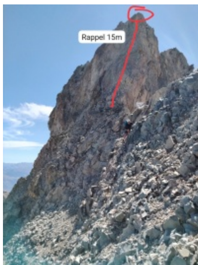
Rappel et début de la traversée pourrie vue d'en bas