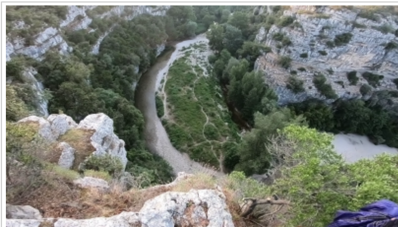
Vue de l'exit

Exit original au plus haut malgré une belle margelle en contrebas à droite et à gauche. Axe du saut vers le Nord-Est, axé avec la plage, enfermement oblige. (vous comprendrez pourquoi :))