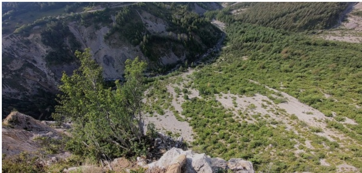
Vue de l'exit