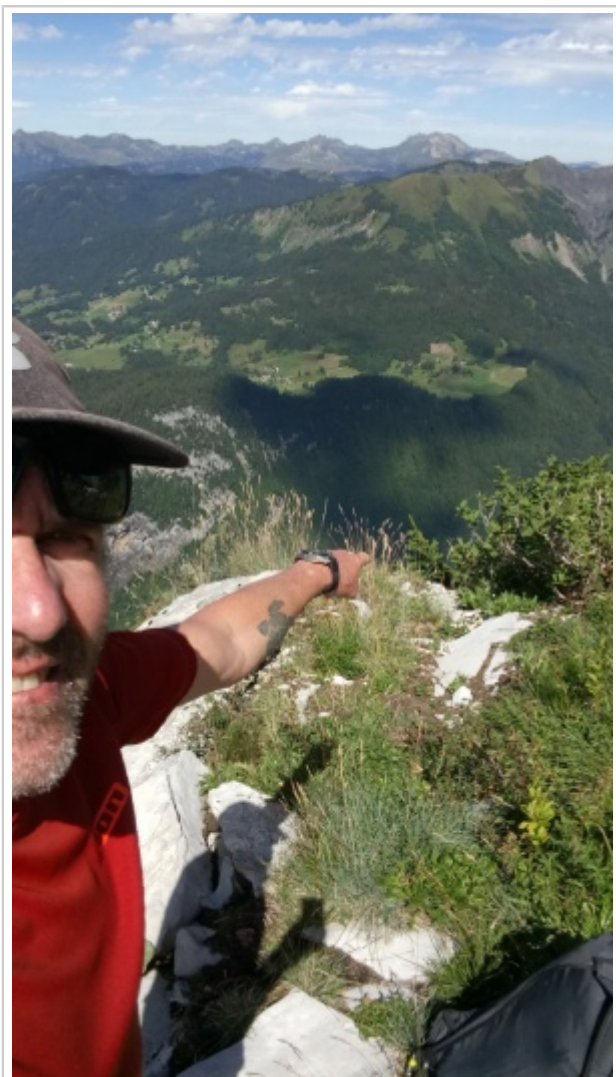
Jardiland : Rampe