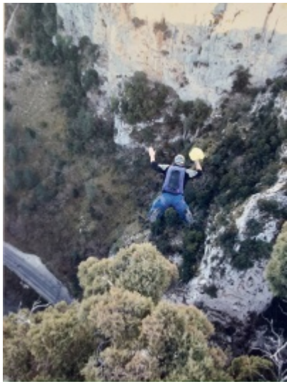
Gorge de Saint Georges

Il est possible de gravir la montagne par les tuyaux de la centrale hydroélectrique sur la route forestière derrière la falaise. Au grand virage en épingle à cheveux à droite, il y a un petit sentier non balisé menant à la montagne jusqu'à une petite ruine. À la ruine, tournez à gauche à travers un petit tunnel et suivez le contour jusqu'à ce que vous arriviez au point de vue avec les balustrades en acier. Le point de sortie est à 15m après les balustrades en descendant sur les rochers jusqu'à l'endroit.