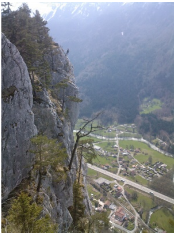
Profil du départ