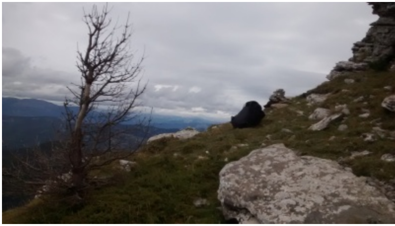
Exit (Classique) de la vidéo (Arbre mort bien caractéristique et cairn ajouté récemment)

Vidéo du saut réalisé par Renaud Fageon depuis l'exit classique