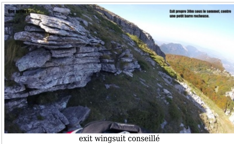
exit wingsuit conseillé

1 / Exit conseillé wingsuit et autre / Descendre de 30m depuis le sommet vers la vallée du Rhône (Crest) coté gauche face au vide, l'exit se trouve juste contre la petite barre rocheuse. Le départ est très propre sur une belle petite dalle plate et le dessous est parfaitement (et très) déversant jusqu'en pied de face (tape à 9s). Petit cairn. Possibilité de prise d'élan.(Voir photos).