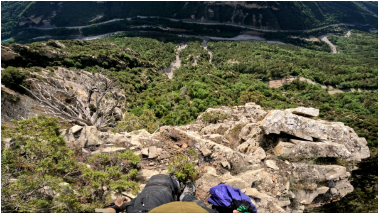
Vue de l'exit

Récupérée de « https://www.base-jump.org/topo/index.php?title=Bairols&oldid=9676 »