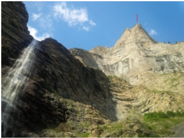
Adieu le 2-5