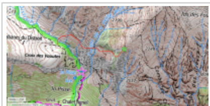
Accès par la vire à bicyclette